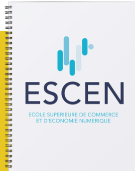
1 BOOK NOTE