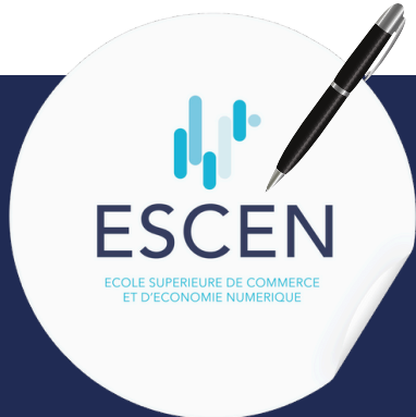
1 STYLO ET 1 AUTOCOLLANT