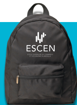
1 SAC À DOS