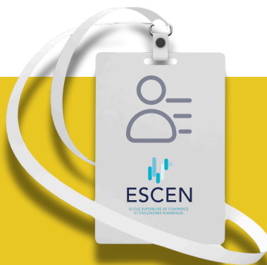
1 BADGE NUMÉRIQUE